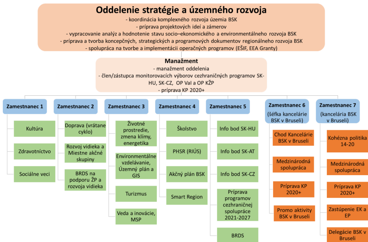
Schéma 1: Súčasné nastavenie Oddelenia stratégie a územného rozvoja

Ministerstvo vnútra SR ako Riadiaci orgán pre OP EVS vyhlásilo dňa 15.05.2019 výzvu s názvom „Inteligentný a lepší samosprávny kraj“ pre vyššie územné celky. Výzva je zameraná najmä na budovanie inštitucionálnych kapacít a zvyšovanie efektívnosti verejnej správy a verejných služieb.